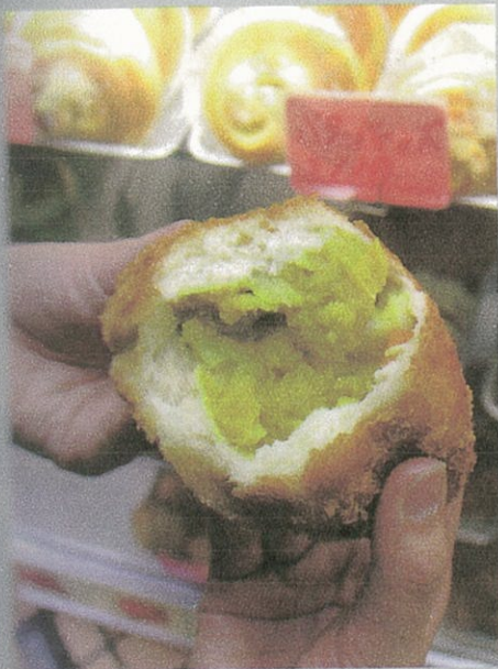
●「オムラパン」ジャガイモを中心とした野菜がたっぷり入ったカレーパン110円は家庭的で素朴な味わい。東京都荒川区南千住1-29-6 ☎03-3891-2957 ●「とりふじ」の店先。旨い惣菜がずらりと並んでいる。