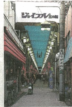
三ノ輪銀座商店街振興組合 ☎03-3801-1633 www.joyfulminowa.com/ ※